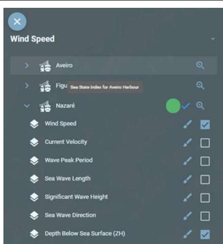
Pormenor do menu das camadas no geoportal