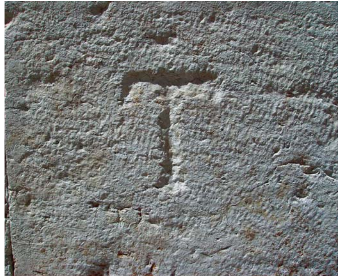
A inscrição de um T faz alusão clara à Ordem da Santíssima Trindade que ocupou o edifício.

As inscrições epigráficas nas catedrais e outras construções serviam para identificar as ordens ou corporações de ofícios que estiveram na sua origem, muitas das quais tiveram entre nós origem nas confrarias religiosas dos finais do século XIV.