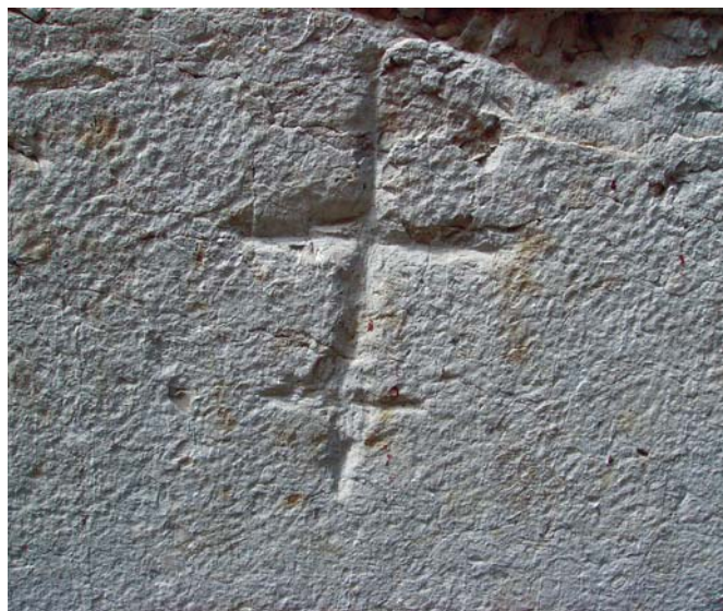
A imagem mostra o T acoplado a uma cruz.