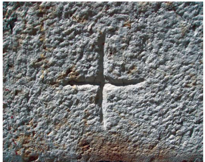
A cruz constitui a inscrição mais recorrente nas paredes do edifício.