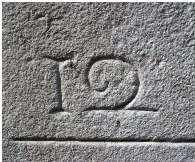
Inscrição epigráfica no Convento das Trinas do Rato