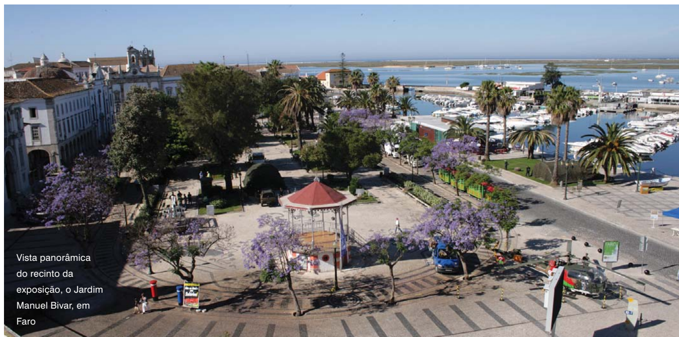
Vista panorâmica do recinto da exposição, o Jardim Manuel Bivar, em Faro