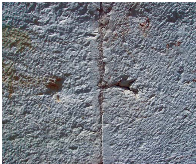
Esta representação da cruz da Ordem da Santíssima Trindade acusa um evidente desgaste