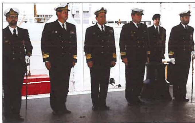
Da esquerda para a direita: O comandante que recebeu o comando do navio, o C/Almirante comandante da Flotilha, o C/Almirante Comandante Naval, e Comandante do Agrupamento de Navios Hidrográficos e o Comandante que entregou o comando.

Em nome do Comando Naval, desejou felicidades a ambos.