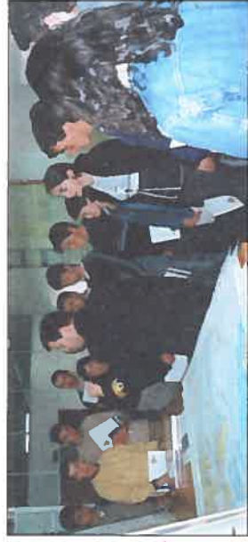
Os alunos da ES/3 D. Egas Moniz