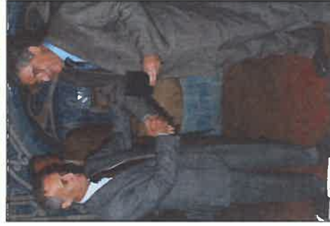
O General Paiva Morão e o Vice-Almirante Torres Sobral