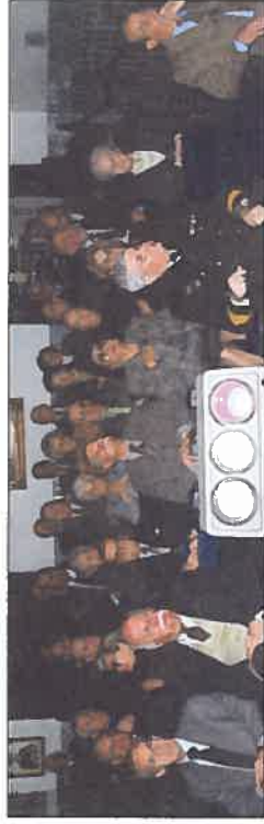
Os antigos alunos do Colégio Militar

No fim da visita todos mostraram o seu reconhecimento por tão esclarecedora visita e pelo amigoso convívio proporcionado.