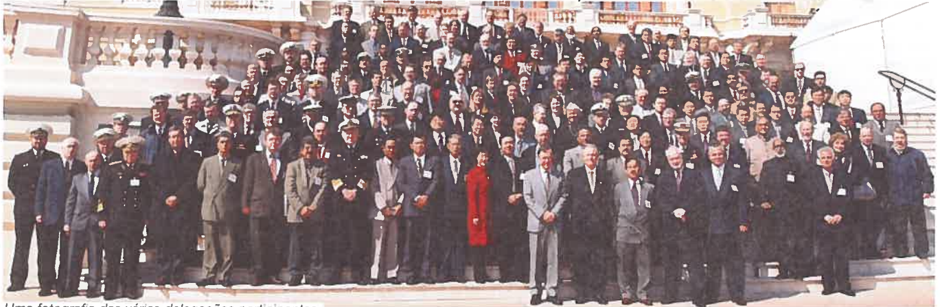
Uma fotografia das várias delegações participantes.