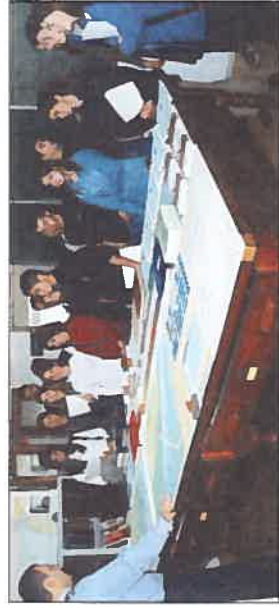
Os alunos da EB2,3 D. Manuel I.

tas náuticas oficiais e ainda da preservação do meio ambiente. Foi então efectuada uma visita à Direcção Técnica e às Divisões que a compõem, no sentido de prestar aos jovens visitantes uma descrição geral das actividades desenvolvidas em cada um dos sectores, que em conjunto (e em colaboração com todos os outros que lhes prestam apoio) contribuem para que as missões do IH tenham concretização.