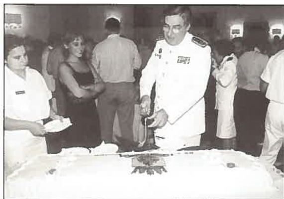
O Director-Geral corta o bolo com a sua espada.