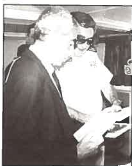
A presença do CFR Zenóbio Cavaco na inauguração da Exposição.

navio afundado no rio Tejo, um aparelho que nos permite localizar o ROV quando este está dentro de água e um monitor transmitindo imagens do fundo do mar provenientes do ROV. Noutra bancada estava exposto o laboratório de química com diferentes frascos de recolha de água para cada parâmetro de análise.