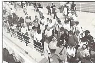
O público a aguardar para visitar o navio.

A bombordo estavam expostos alguns dos equipamentos da Divisão de Química e Poluição do Meio Marinho: duas dragas para recolha de sedimentos superficiais, uma garrafa de recolha de água e um equipamento de recolha de sedimentos de profundidade. Seguidamente, o público era encaminhado para o laboratório onde estava a passar o vídeo demonstrativo das actividades do IH. Encontrava-se também exposto um registo obtido pelo sonar lateral com a particularidade de mostrar um