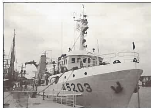
O NRP «ANDRÓMEDA» na EXPO.

O percurso da visita seguia para fora da ponte, onde as pessoas desciam outras escadas que terminavam na tolda do navio. Este local estava ocupado com equipamentos da Divisão de Oceanografia, nomeadamente um correntómetro, o ROV (veículo submarino de controlo remoto), que despertou sempre bastante atenção por quem passava, um sonar lateral e um