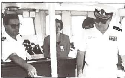
Visita à ponte do navio.

tamente a actividade do Instituto Hidrográfico, o nível de desenvolvimento e a capacidade dos seus métodos de trabalho bem como os navios hidrográficos de que a Marinha e o IH dispõem. Ficavam deslumbradas com tudo o que lhes era mostrado e com os resultados obtidos através da actividade do IH.