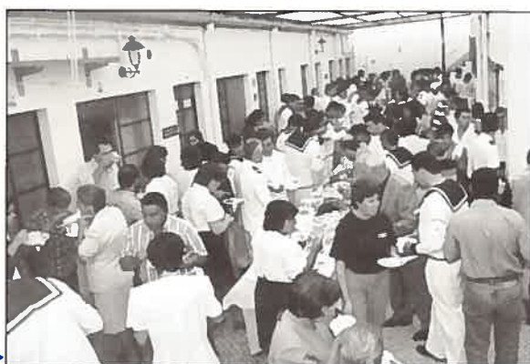
Um momento de convívio num dos pátios do IH.