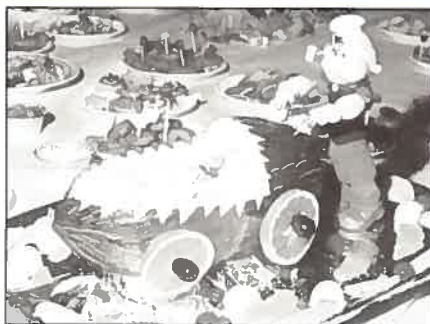
Aspecto de uma das mesas da festa.

No fim da cerimónia todos se dirigiram para os locais onde estavam postas as mesas para o almoço-convívio dispostas pelo refeitório e pátios do IH.