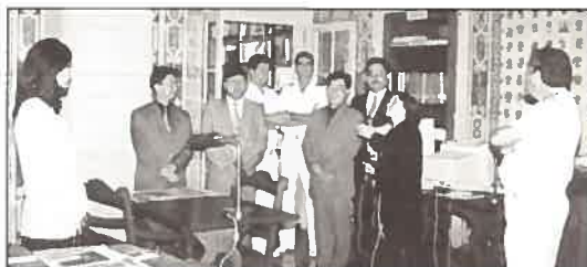
A delegação da Capitania dos Portos de Macau na sua passagem pela Biblioteca do IH.

No dia 1 de Outubro, a delegação deslocou-se às Instalações da Azinheira, onde visitou a Brigada Hidrográfica.