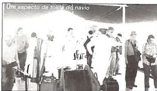
Um aspecto da tolda do navio