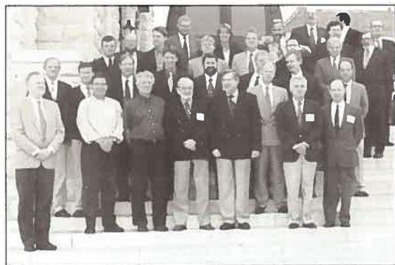
A delegação do CRCE/EN.

A produção de Cartas Electrónicas de Navegação Oficiais constitui um objecto essencial e de elevado potencial no desenvolvimento portuário e da gestão dos recursos costeiros acentuando a vocação marítima de Portugal no contexto Europeu.