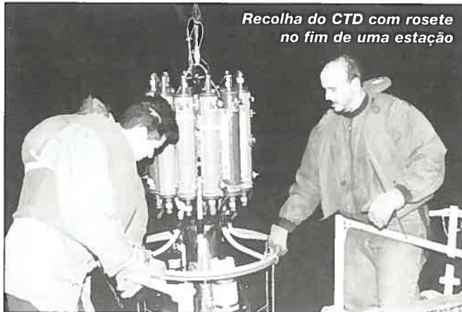
Recolha do CTD com rosete no fim de uma estação

No próximo número do HIDROMAR daremos conta dos resultados obtidos nesta missão.