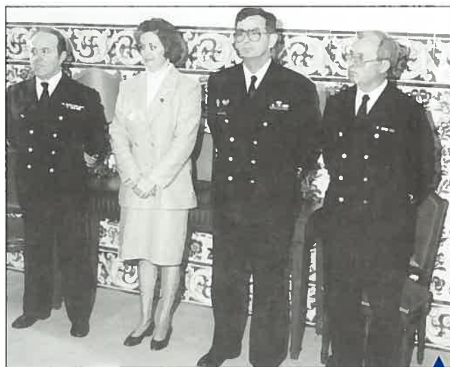
Os Directores presentes na cerimónia.