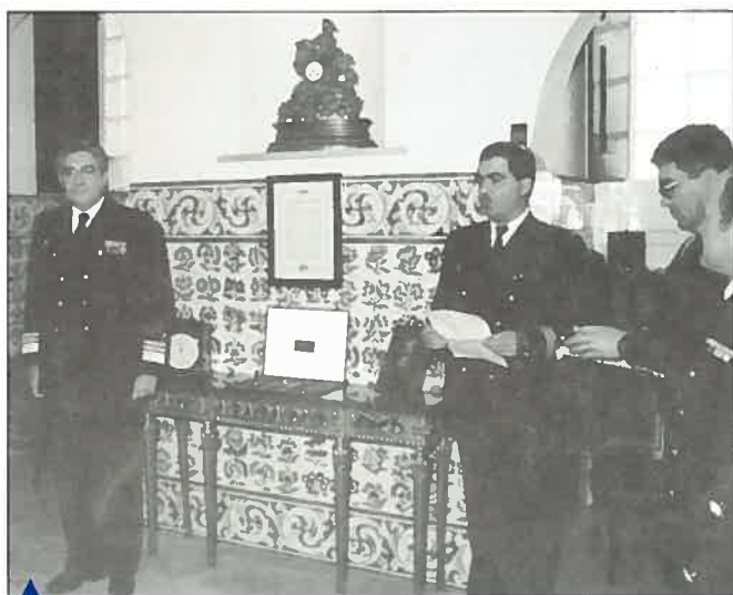
Leitura da Ordem do IH, que deu início à cerimónia.

O HIDROMAR felicita-os e deseja-lhes um óptimo prosseguimento nas suas carreiras!