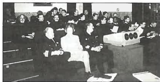
Vista geral da audiência no momento da apresentação das palestras.

Terminada a sessão, o curso iniciou o percurso da visita ao IH pela Divisão de Cartografia, seguindo depois para a Divisão de Oceanografia, onde lhes foram feitos breves briefings sobre as actividades aí desenvolvidas. Posto isto, foi conhecer o Centro de Documentação e Informação/Biblioteca, terminando aqui esta visita de estudo ao Instituto Hidrográfico.