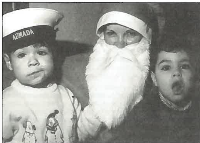
Ninguém dispensa a presença do Pai Natal, muito menos os nossos marinheiros.