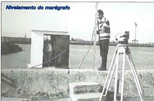
Nivelamento do marégrafo