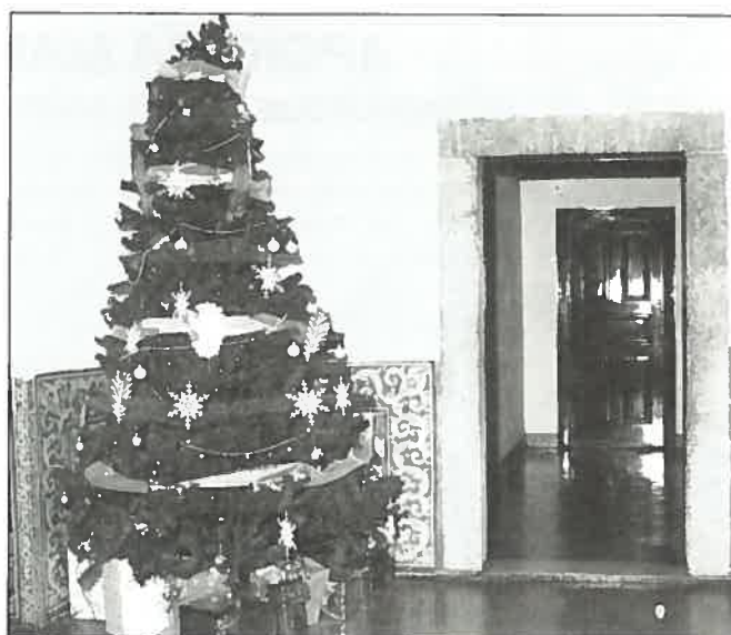
A árvore de Natal do IH. Todos os anos se opta por uma decoração diferente, mas sempre muito imaginativa.