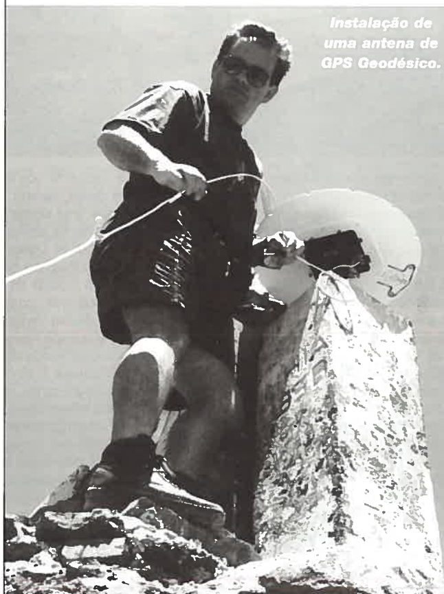
Instalação de uma antena de GPS Geodésico.

O texto que se segue reflecte apenas a visão do autor acerca do assunto tratado. Ao Instituto Hidrográfico não cabe qualquer responsabilidade nem no conteúdo nem na forma de apresentação do assunto. O texto poderá apresentar uma forma simplista de ver o problema, era esse o objectivo, mas a complexidade do tema nem sempre permite simplificá-lo demasiado, pelo que espero que os leitores entendam a intenção e possam, pelo menos, ficar alertados para essa complexidade. Quando iniciei a escrita deste texto apenas pretendia abordar o tema de uma forma generalista, espero tê-lo conseguido.