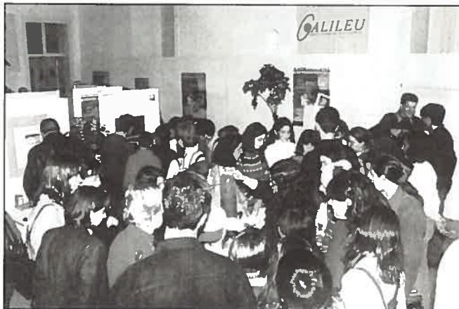
A Sala das Universidades - um dos aspectos da exposição.

Tal como nos anos anteriores, a grande adesão de estudantes de todo o país demonstra que a participação do IH neste tipo de eventos é portadora de uma extrema importância, no sentido de mostrar aos futuros decisores do nosso país – e não só – o que é possível fazer no campo da investigação nas áreas científica e defesa do ambiente marinho.