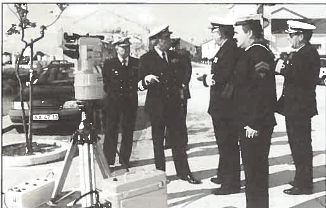
O Almirante CEMGFA, assistindo à demonstração do equipamento de posicionamento Polarix.

O Chefe de Estado-Maior-General das Forças Armadas, Almirante Fuzeta da Ponte deu especial atenção à demonstração com o equipamento exposto, já que um dos objectivos desta visita era precisamente inteirar-se dos trabalhos e projectos executados e em fase de desenvolvimento das várias áreas de actuação do Instituto Hidrográfico, nomeadamente no que diz respeito ao aspecto da modernização dos processos de recolha e tratamento de dados hidrográficos e oceanográficos.