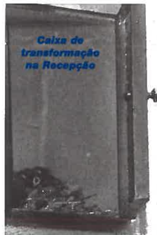
Caixa de transformação na Recepção