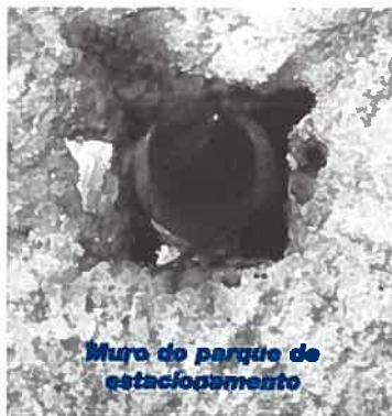
Muro do parque de estacionamento

Quando a Primavera chegou ao Instituto, recebemos também a visita inesperada de diversas famílias com o intuito de por aqui criarem os seus «rebentos». Ocuparam vários espaços e nem a cozinha escapou com os seus pássaros de «D. Laranja e D. Alface»