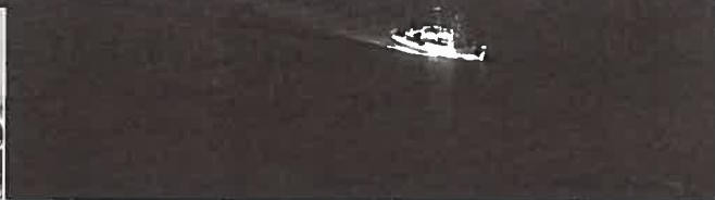
Fotografias do momento da chegada do NRP «D. Carlos I» a Lisboa, obtidas por: Cte. Carlos Lemos (em cima e à esquerda) e Carlos Dias (em baixo).